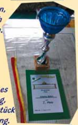
Ja, dann gibt es zur Belohnung, diese Schmuckstück für die Wohnung.