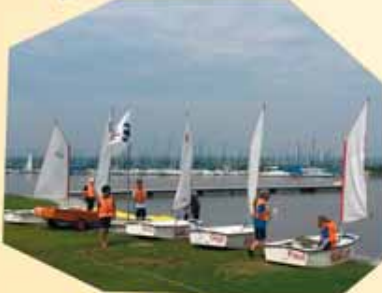
... es ist famos ... - und jetzt geht's los!