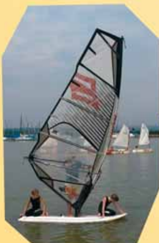
Zu dritt auf dem Surfbrett ist es auch ganz nett.