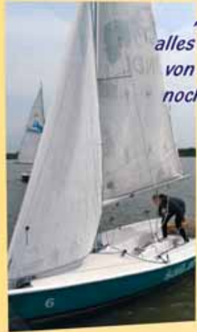
„Zum Teufel ...“, alles Schnürl und Fetzen, von euch lass' ich mich noch lang nicht hetzen.