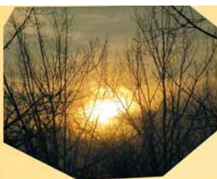
Die Sonn' die frisst den Schnee schon auf, und mit dem Winter ist's jetzt aus.