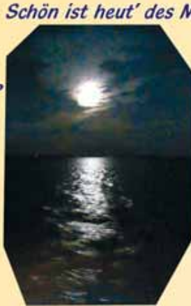
Schön ist heut' des Mondes Licht, und hier dampft es und es zischt.