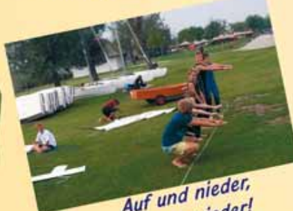
Auf und nieder, immer wieder!