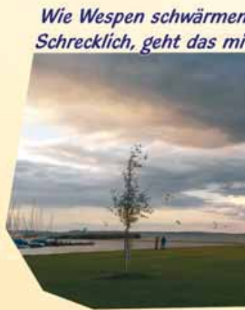
Wie Wespen schwärmen Schrecklich, geht das mi