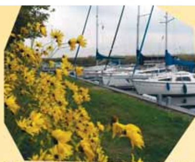
Geputzt stehn's da in Reih' und Glied, schon ist es Frühling wie man sieht.