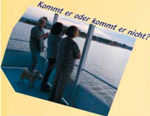
Kommt er oder kommt er nicht?