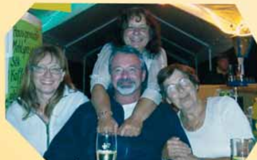
„Zurück geblieben“ in froher Runde, vom Sommerfest zu später Stunde.