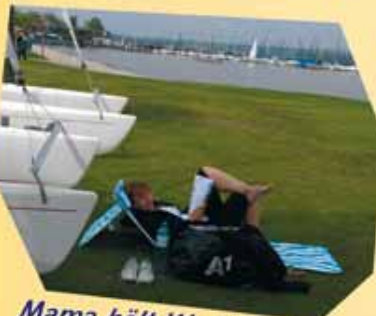
Mama hält Wache, schaut gern ihnen zu, denn die haben 's begriffen im Nu.