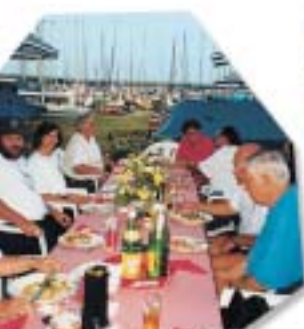
Besuch beim YCBb