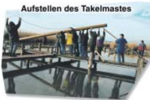
Aufstellen des Takelmastes