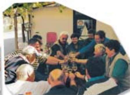
Absegeln nach Illmitz