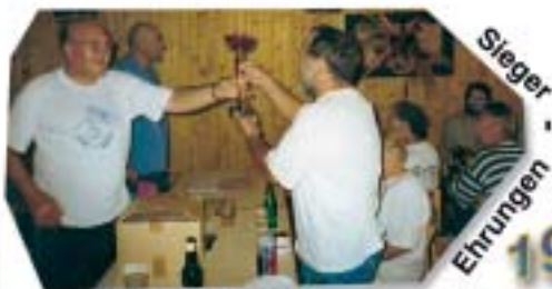
die 1. Regatten