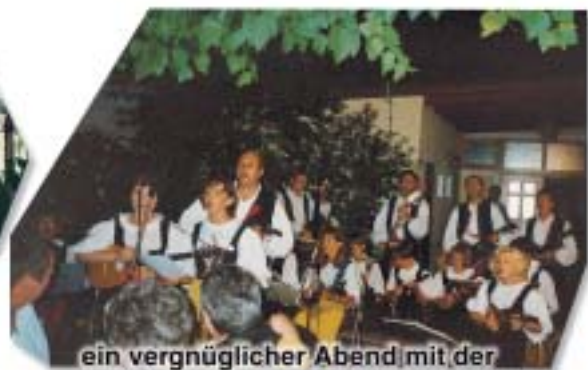
ein vergnüglicher Abend mit der Tamburica-Gruppe in Osip