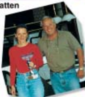
Auch die Jugend ist dabei