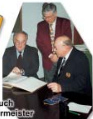
1. Besuch beim Bürgermeister