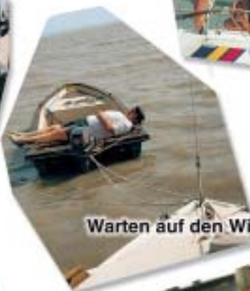
Warten auf den Wind - los geht es!