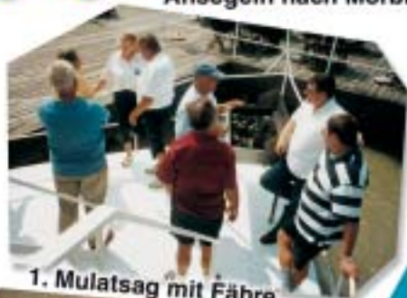
1. Mulatsag mit Fähre