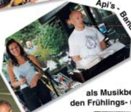
als Musikbegleitung bei den Frühlings- u. Sommerfesten