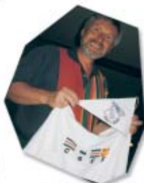
Fahrtensegeln zum SCNW mit Übergabe Wimpel und CSCR-Leibchen