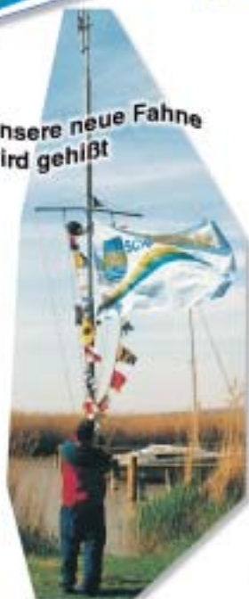
Unsere neue Fahne wird gehißt