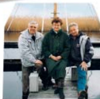
das 1. Redaktionsteam