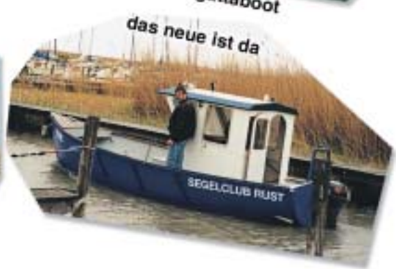
das neue ist da