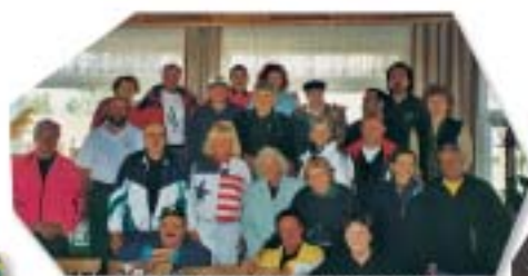
Ansegeln nach Mörbisch