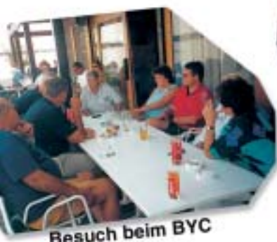
Besuch beim BYC