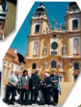
Ausflug Melk und Donauschiffahrt