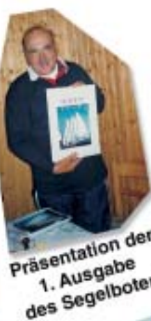
Präsentation der 1. Ausgabe des Segelboten