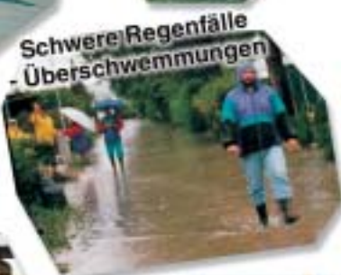
Schwere Regenfälle - Überschwemmungen