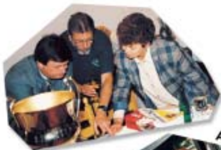
Api's - Band