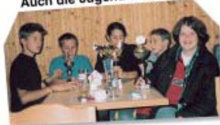
Da freut sich der Regattaleiter!